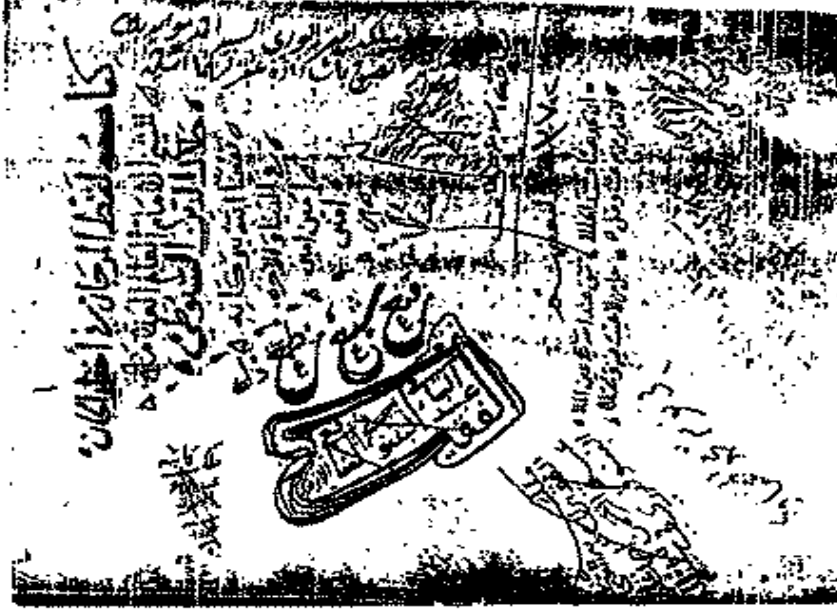
الصفحة الأولى من المخطوط (رقم ٥)